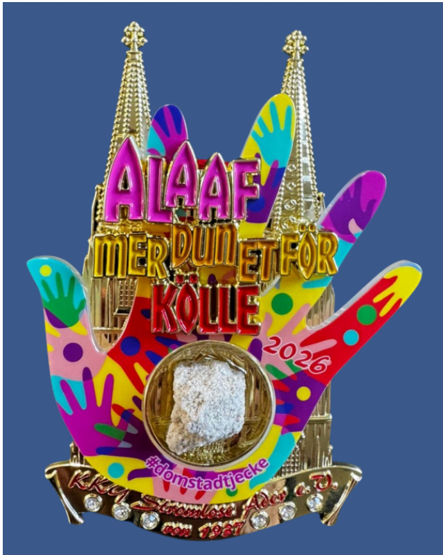
Der Sessionsorden 2026 der Stromlosen Ader

und vorangetrieben. Ihr Antrieb und Engagement ermöglicht es die Traditionen aufrecht zu erhalten und ganzjährig für Spaß und Stimmung zu sorgen.