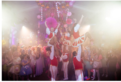
Tanzcorps „Colonia Rut Wiess“