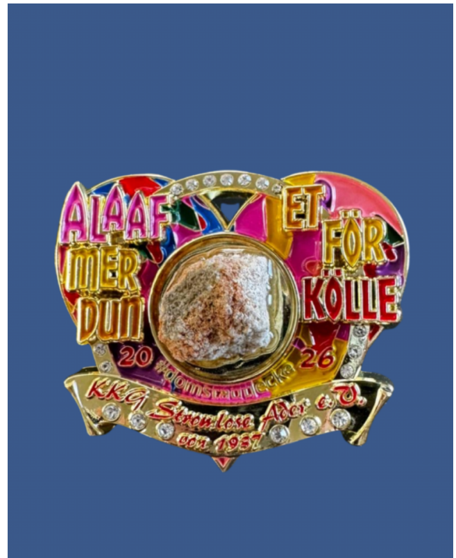
Der Damenorden 2026 der Stromlosen Ader

Der Dom als Wahrzeichen, Fixpunkt und stiller Wächter über Köln symbolisiert genau diese Beständigkeit und ist deswegen als zentrales Element des Sessionsorden auserwählt worden. So kann jeder Jeck ein Stück des Doms bei sich tragen. Einen Stein, der Jahrhunderte überdauert hat und für Zusammenhalt, Verantwortung und Verbundenheit steht. Oder, wie es in Köln heißt: Mer dun et för Kölle – all die ganze Jahr!