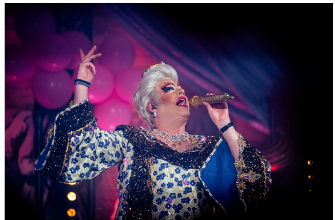
„Julie Voyage“ – Ken Reise

Die Gäste erschienen in einer überwältigenden Vielfalt an phantasievollen Kostümen: schillernde Pralinen, bunte Wundertüten, funkelnde Zuckerwesen und kölsche Knallbonbons bestimmten das Bild. Ob glamourös, schrill, verspielt oder elegant – jede Verkleidung erzählte ihre eigene Geschichte. Die Damenparty der StattGarde Colonia Ahoj zeigte einmal mehr, wofür sie steht: Offenheit, Vielfalt, Respekt und die pure Freude am gemeinsamen Feiern.