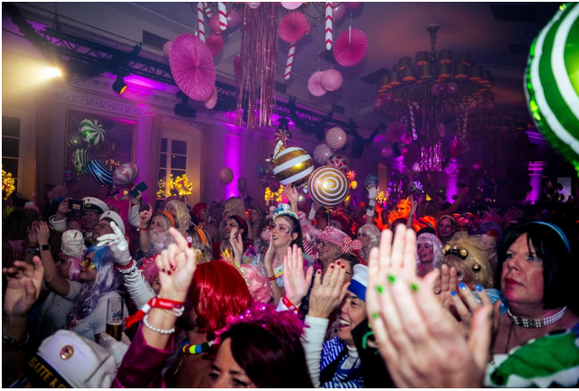
Funkelndes Candyland voller Phantasie, Lebensfreude und ausgelassener Toleranzes Publikum