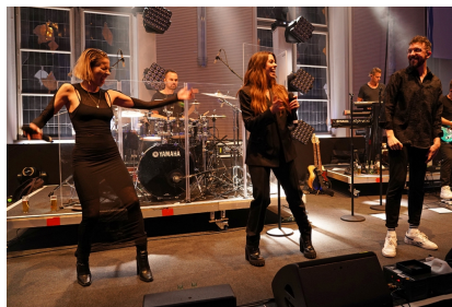
Vanessa Mai mit Band