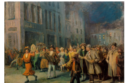
Solingen, private Sammlung, Rafflenbeul-Kroh, Hella Bild, Öl, Kroh, Heinz, Titel unbekannt

Bereits in den ersten Jahren definierte dieses Komitee die wesentlichen Grundpfeiler, die bis heute die fünfte Jahreszeit prägen. Dazu gehörten der Rosenmontagszug oder die Einsetzung