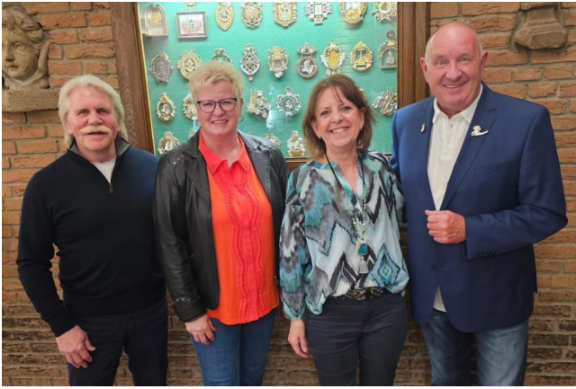
Der bisherige Vorstand der Kleine Erdmännchen e.V.