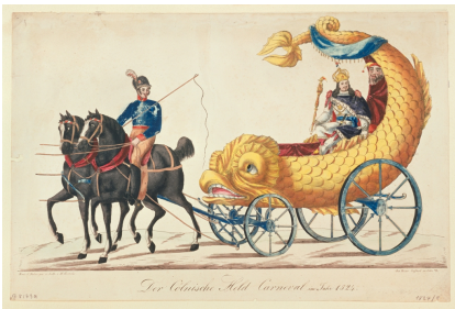
Köln, Kölnisches Stadtmuseum, Graphische Sammlung, Inv.-Nr. G G 8179a, Goebels, Wilhelm Heinrich Goffart, Heinrich, Rosenmontagszug 1824, Zyklus, Chromolithographie, Der Cölnische Held Carneval

Viele Organisationselemente und Charakteristika des heutigen Karnevals entstanden bereits im 19. Jahrhundert. Am 10. Februar 1823 zog der erste organisierte Maskenzug über den Kölner Neumarkt – damals eine Reaktion auf das Ausufern des fastnachtlichen Fests und das drohende Verbot durch die preußischen Herrscher. „Es galt, das wilde Treiben in geordnete Bahnen zu lenken und Regeln aufzustellen“, erklärt Silvia Rückert. „Die Neuorganisation des Karnevals und seiner Dramaturgie oblag fortan einem ‚Festordnenden Comité‘, dem heutigen Festkomitee Kölner Karneval.“