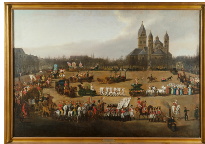
Kölnisches Stadtmuseum, KSM, Meister, Simon, Der Kölner Rosenmontagszug des Jahres 1836, Inv.Nr. KSM 1973/29, Öl, Leinwand, 91,5 x 134,4 cm