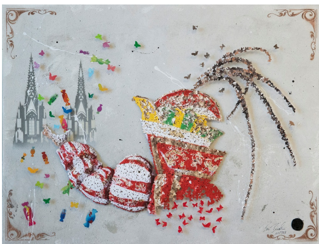
Motiv Big Boss Prinz

Der Neustart des Kölner Karnevalsmuseums war notwendig geworden, weil bei einer Mauer in den Räumlichkeiten am Maarweg eine Erneuerung der Brandschutzmaßnahmen anstand. Diesen Umbau nutzen die Museumsverantwortlichen für eine Überarbeitung der aktuellen Ausstellungsmodule, die durch den Erlös der Kunstaktion nun unterstützt wird. In Pop-Up-Ausstellungen an der Hofburg des Kölner Dreigestirns (DORINT am Heumarkt) sowie auf weiteren Flächen in Köln erleben Karnevalisten diese sowie weitere Werke von Ben Buechner hautnah. Der Eintritt ist kostenlos, Exemplare der Editionen können vor Ort im Artshop oder online über den artstar Verlag erworben werden: https://artstar-verlag.de .