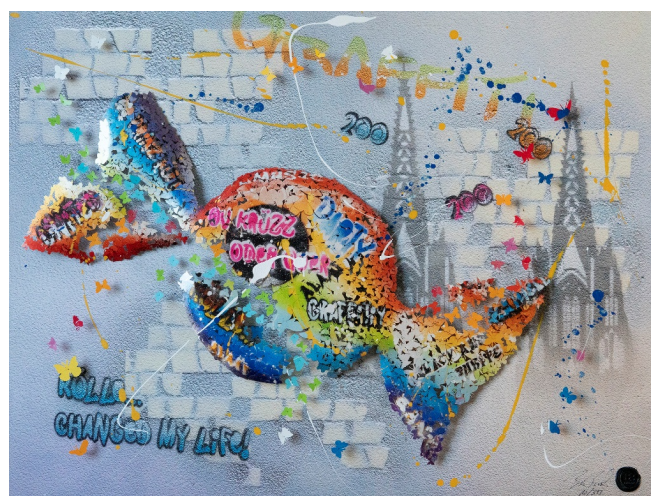
Motiv Kamelle, Sex & Rock'n'Roll