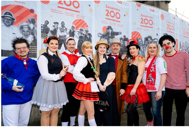
Team Tanzgruppe Kölsch Hännes'chen