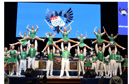
Tanzgruppe „Zunft Müs“