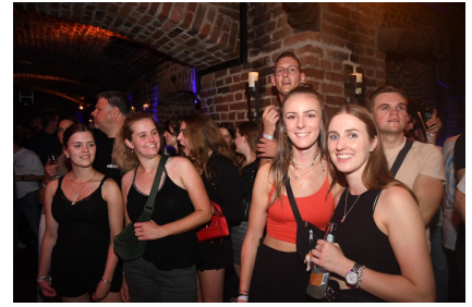
Ein weiteres neues Partyformat der Blauen Funken findet Gefallen beim jungen Publikum

Organisiert wurde das Event vom Kreisverband der Pferdesportvereine Köln e.V. (Dachverband der Region Köln), den Kölner Studentenreitern (Kölner Gruppierung des Deutschen Akademischen Reiterverbandes) und der Kölner Funken Artillerie blau weiß von 1870 e.V. „Blaue Funken“ (dem ältesten im Ursprung komplett berittenen Kölner Traditionskorps).