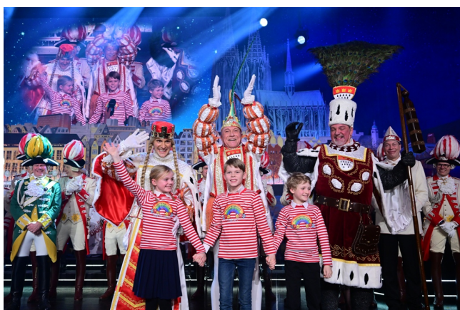
Das Kölner Dreigestirn 2025 mit den designierten Kölner Kinderdreigestirn 2025

Der zweite Akt stand ganz im Zeichen des Kölner Dreigestirns. Nach der offiziellen Proklamation folgten der Einzug der Dreigestirngesellschaft StattGarde Colonia Ahoj e.V. und ein gemeinsamer Tanz mit der Kölner „Jungfrau Marlis“, die im wahrsten Sinne des Wortes auf Händen getragen wurde. Den krönenden Abschluß des Abends bildete der dritte und letzte Akt mit dem Auftritt von „Kasalla“. Mit neuen Sessionshits und alten Klassikern brachten die Jungs ordentlich Schwung in den Saal. Das große Finale schloß die Proklamation des Kölner Dreigestirns mit buntem Konfetti ab.