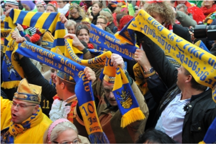
Donnerstag, 11. November 2010