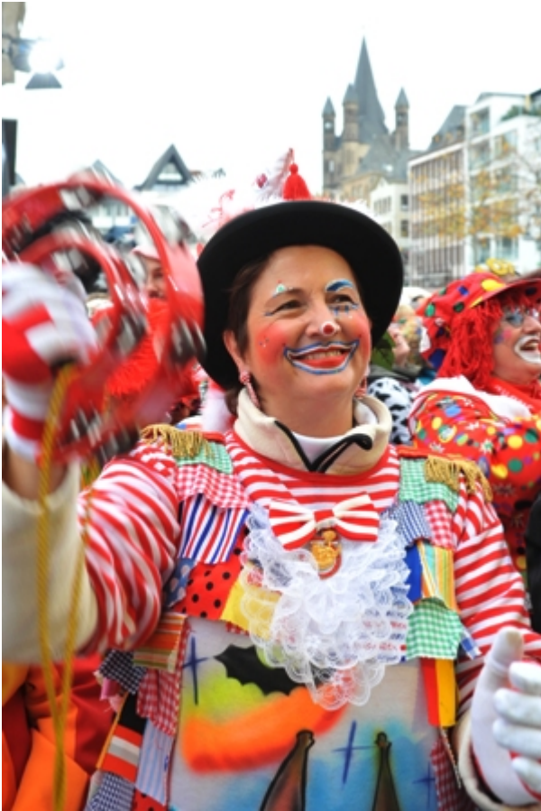
Donnerstag, 11. November 2010