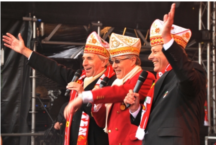
Donnerstag, 11. November 2010