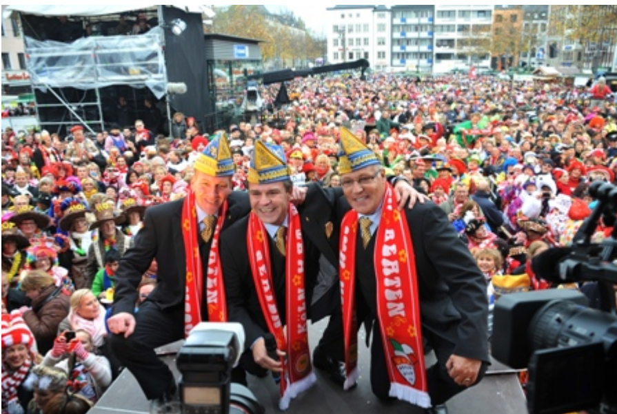
Donnerstag, 11. November 2010