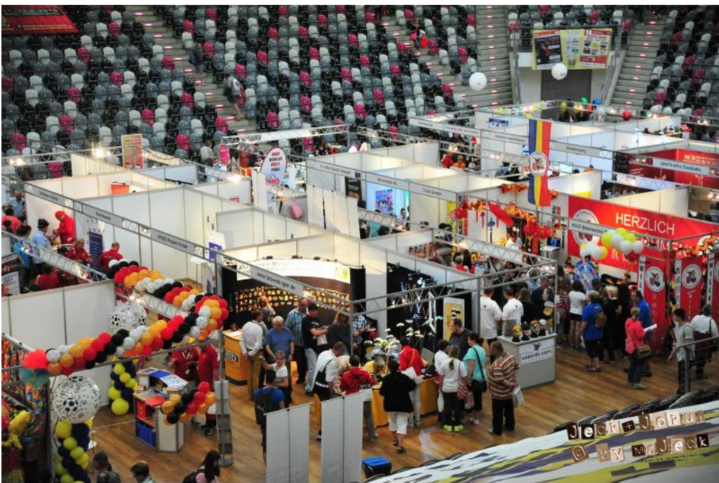
Samstag, 11. Juni 2016