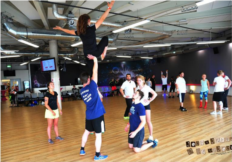
Samstag, 11. Juni 2016