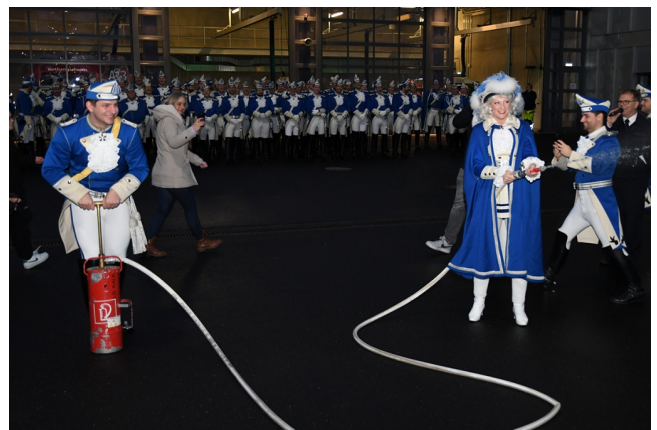
Das Blaue Funken-Tanzpaar