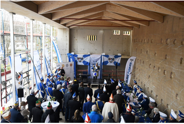
Ein erster Blick in den Rohbau des neuen großen Saales im 1. OG des Anbaus am Sachsenturm