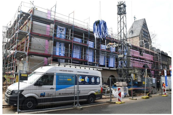
Auch von außen ein imposanter Anblick: der große Saal öffnet sich stadtseitig mit deckenhohen Fenstern