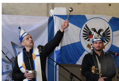
Im Anschluß an