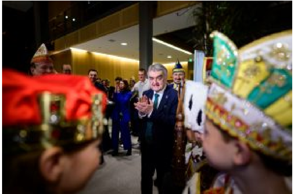
In der Landesvertretung NRW mit NRW-Innenminister Herbert Reul