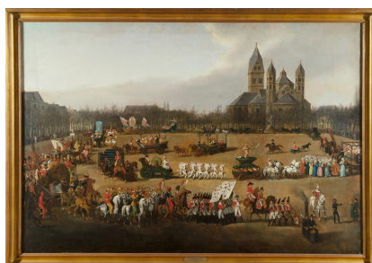
Kölnisches Stadtmuseum, KSM, Meister, Simon, Der Kölner Rosenmontagszug des Jahres 1836, Inv.Nr. KSM 1973/29, Öl, Leinwand, 91,5 x 134,4 cm