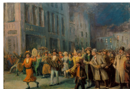
Solingen, private Sammlung, Rafflenbeul-Kroh, Hella Bild, Öl, Kroh, Heinz, Titel unbekannt