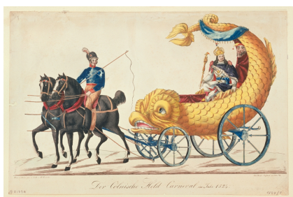
Köln, Kölnisches Stadtmuseum, Graphische Sammlung, Inv.-Nr. G G 8179a, Goebels, Wilhelm Heinrich Goffart, Heinrich, Rosenmontagszug 1824, Zyklus, Chromolithographie, Der Cölnische Held Carneval

Viele Organisationselemente und Charakteristika des heutigen Karnevals entstanden bereits im 19. Jahrhundert. Am 10. Februar 1823 zog der erste organisierte Maskenzug über den Kölner Neumarkt – damals eine Reaktion auf das Ausufern des fastnachtlichen Fests und das drohende Verbot durch die preußischen Herrscher. „Es galt, das wilde Treiben in geordnete Bahnen zu lenken und Regeln aufzustellen“, erklärt Silvia Rückert. „Die Neuorganisation des Karnevals und seiner Dramaturgie oblag fortan einem ‚Festordnenden Comité‘, dem heutigen Festkomitee Kölner Karneval.“