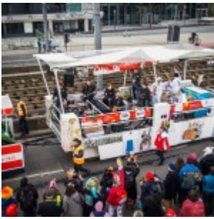
Musikwagen des Literarischen Komitees im Kölner Rosenmontagszug 2023

Nach der Session ist vor der Session: Die Castings für das Literarische Komitee beginnen und alle Künstlerinnen und Künstler für den Kölner Karneval können sich für den nächsten Jahrgang bewerben. Ob Rednerin, Musiker oder Band, das Programm des Literarischen Komitees ist genau die richtige Adresse.