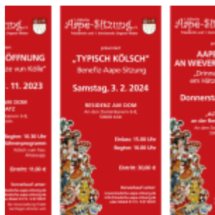
Grafiken: 1. Kölsche Aape-Sitzung e.V.