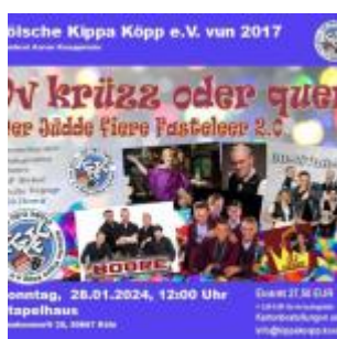
Grafik: Kölsche Kippa Köpp e.V. vun 2017