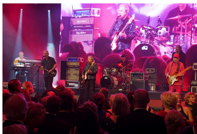
Mit der „Spider Murphy Gang“ stand eine sehr sympathische Band auf der Bühne im Gürzenich, die von der ersten Sekunde an die Feierstimmung anheizte und die in Köln schon fast eine zweite Heimat gefunden hat