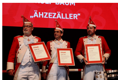
Beförderungen von Funken verschiedener Korpteile