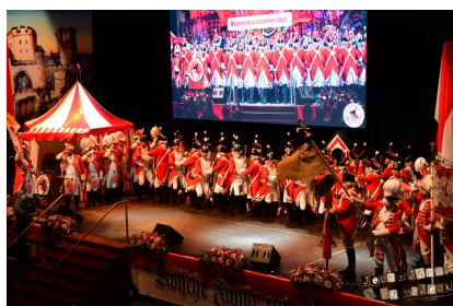
wibbelnde Funken in Aktion