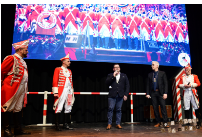
Kötterbüchse- Aktion für die Flutopfer von Rech