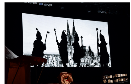
Schattenspiele zur Funken-Kumede

Von hier eröffnete die „Laachduuv vun d´r Ülepooz“, wie der