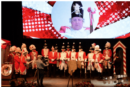
Vereidigung der neuen Rekruten