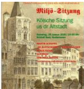
Grafik: Altstädter Köln 1922 e.V.

Kölsche Büttenasse sind Garanten für Kostümsitzung, Mädchensitzung und Luna Sitzungsparty der Große KG Greesberger