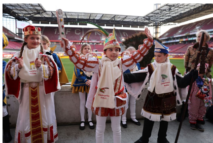
Umjubelt Empfang für die „Pänz“ des Kölner Kinderdreigestirns

„Domstürmer“, die bereits zum dritten Mal an genau dieser Stelle die frohsinnigen Herzen höherschlagen ließen. Im Anschluß machte das „Kölner Dreigestirn“ seine Aufwartung und zeigte allen Gästen, wie sehr sie sich über kleine Lichtblicke wie eben diese Veranstaltung freuen. Musikalisch ging es mit den „Klüngelköpp“ weiter, die in den letzten Sonnenstrahlen alle Zuschauer begeisterten.